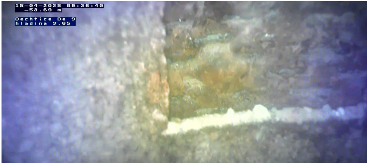
Uvoľnené – otvorené okná vo výstroji