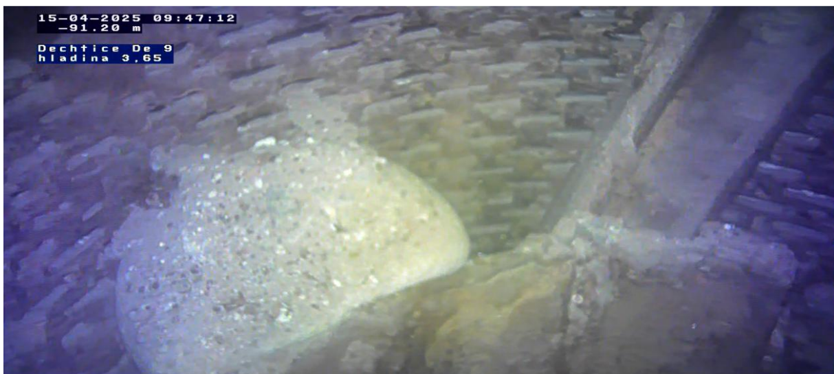
Prechod výstroja v cca 90 m - v medzikruží zapichnutý U profil, ktorý presahuje do vrtu