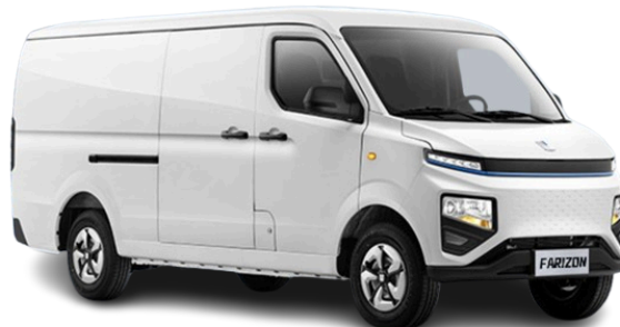
Obrázok je ilustračný