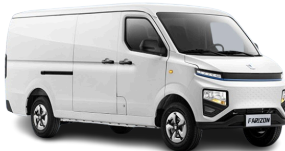
Obrázok je ilustračný