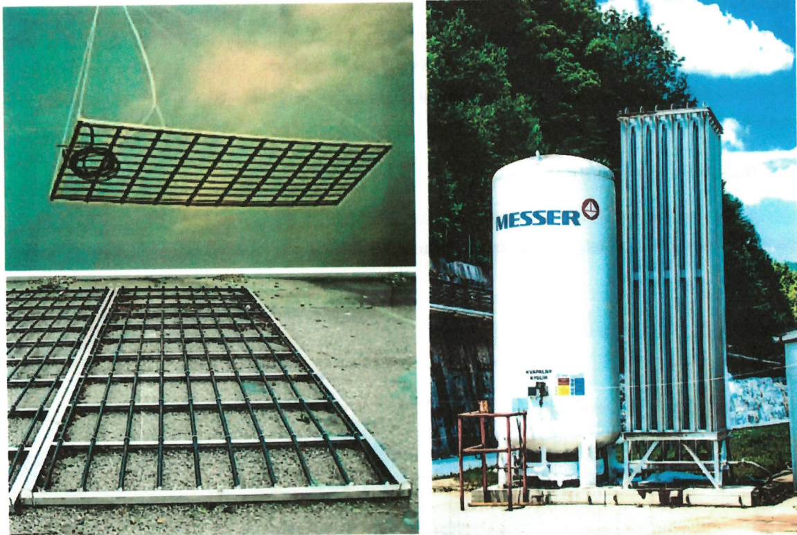
Obr. 2 – 4 Ilustračné fotky: Ponorné rámy pri inštalácii, Zásobník a atmosférický odparovač

Výhodou tohto riešenia je možnosť inštalácie zariadení za prevádzky čistiarne bez nutnosti odčerpania objemu aktivácie. Ponorné rámy budú zavesené na nerezových reťaziach a ukotvené do obvodových stien nádrže. Stacionárny zásobník kvapalného kyslíka bude umiestnený na mobilnom betónovom základe (zaistí Messer) a regulačné panely budú postavené v blízkosti nádrže. Dávkovanie plynu bude regulované automaticky pomocou koncentrácie rozpusteného kyslíka v odpadovej vode aktivácie.